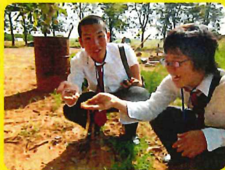
パラナ州の赤い土に触れて驚く 兵庫県の農業高校生