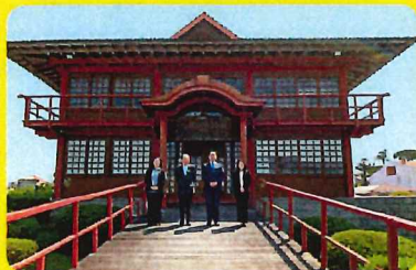
兵庫県、姫路市、パラナ州、クリチバ市の協力で クリチバ市に完成した兵庫姫路会館